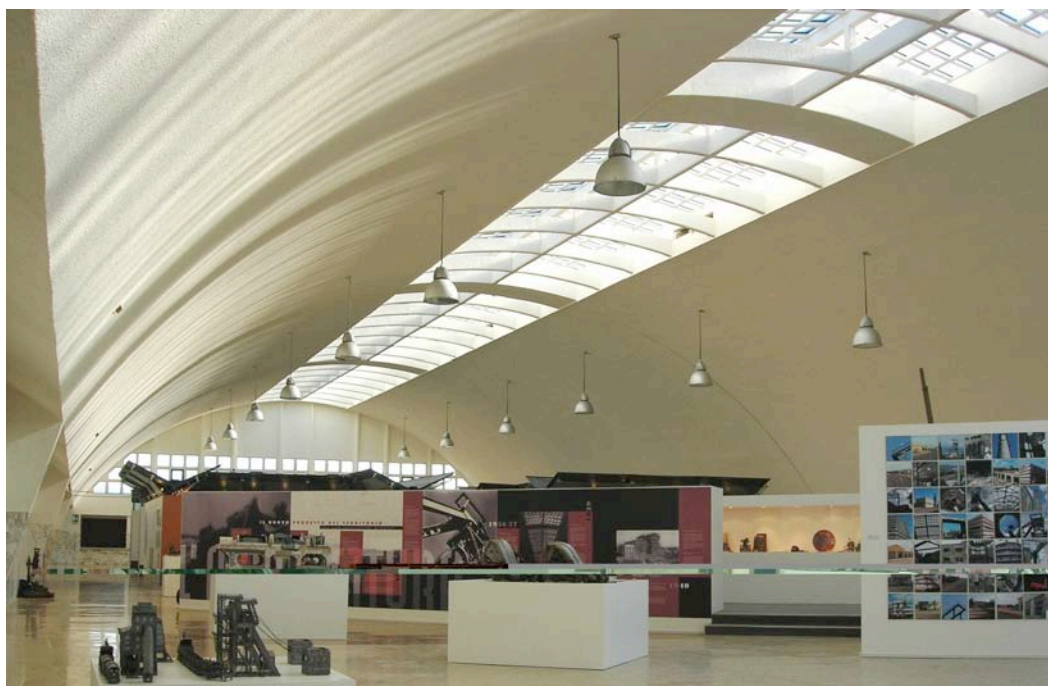
Lampisteria – Museo del Carbone, presso la Grande Miniera di Serbariu (Carbonia)

Le lampade di miniera, ora oggetti-dono per l'allestimento, ancora una volta uniscono miniera e città in una nuova prospettiva culturale. Questi oggetti donati, inoltre, indicano generosità e solidarietà ancora non sopite. Il bel cuore di Carbonia vuole ora abitare in lampisteria.