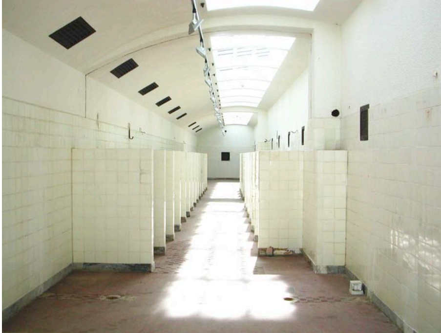
Le docce – Museo del Carbone, presso la Grande Miniera di Serbariu (Carbonia)