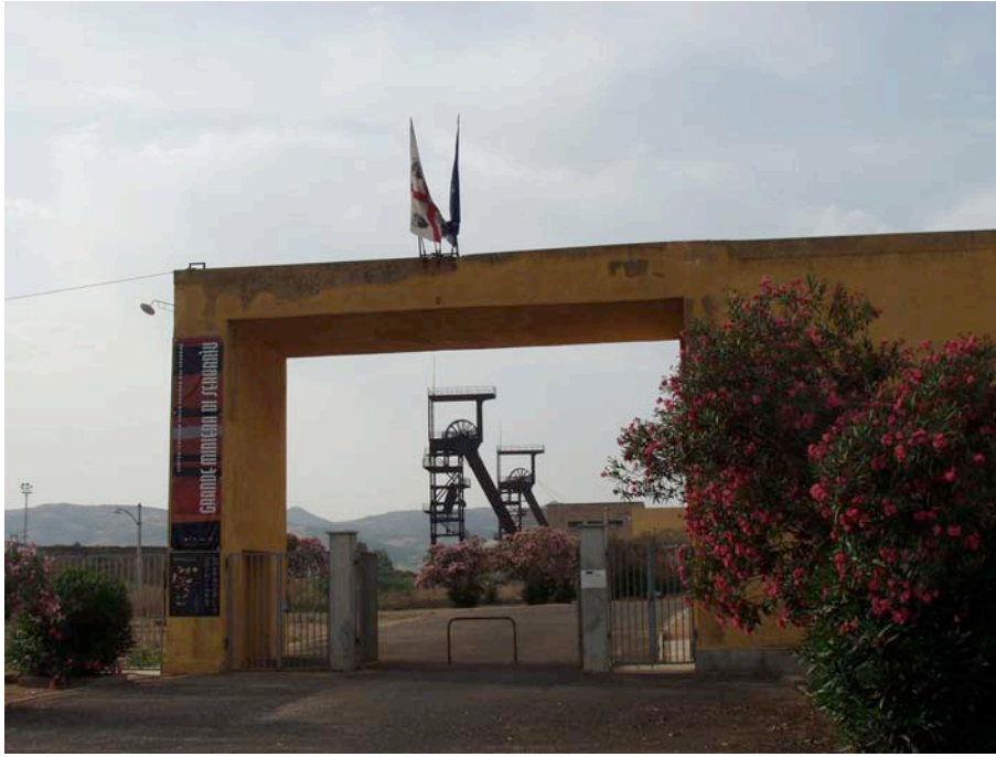
Ingresso – Museo del Carbone, presso la Grande Miniera di Serbariu (Carbonia)

delle discipline antropologiche, implicate nei processi di ricerca-documentazione-esposizione museografica.